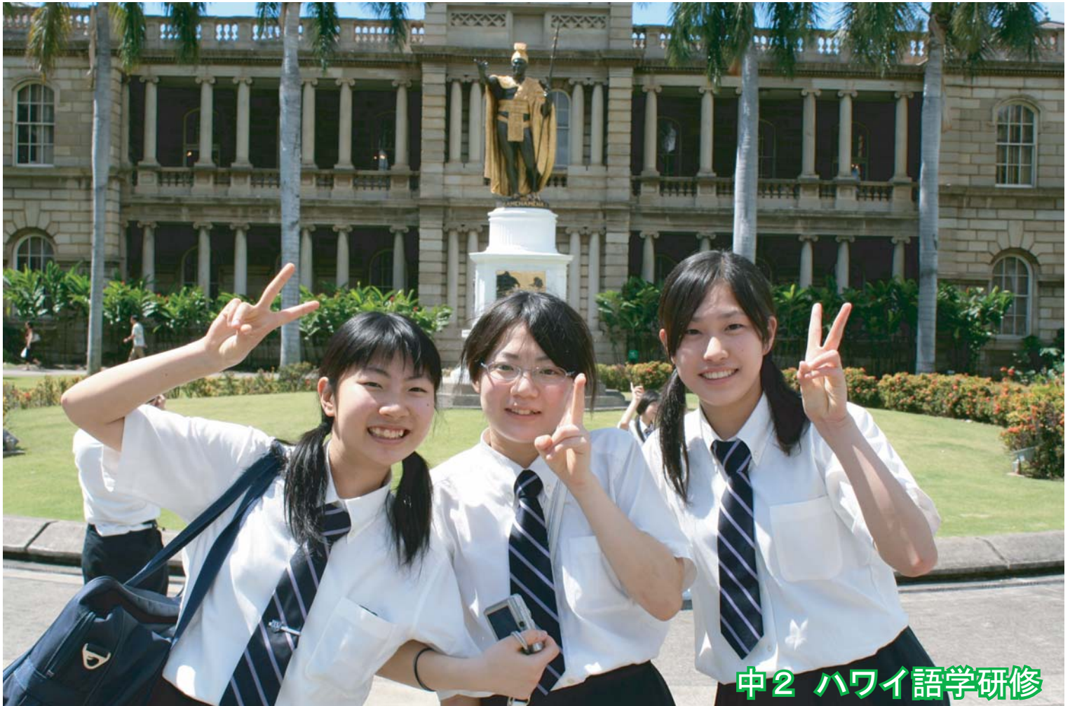
中2 ハワイ語学研修